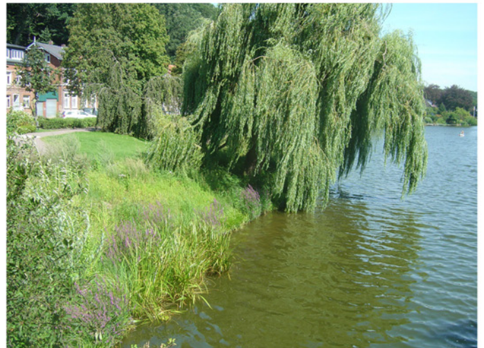
Die ökologische Bewertung (Durchgängigkeit) und die optische Wirkung haben sich nach vier Monaten völlig verändert