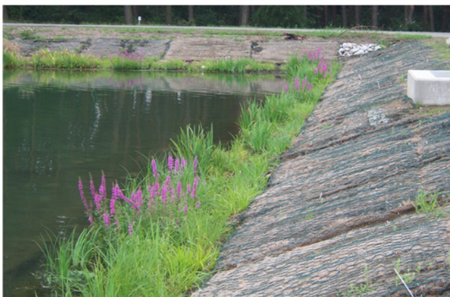
Entwicklung im August 2007. Die Gabionenmatratzen im Wasserwechselbereich wurden mit vorkultivierten Röhrichtmatten belegt. Die Bereiche oberhalb wurden nicht angesät; sondern sollen einer langfristigeren Sukzession überlassen werden