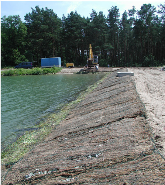
Einbau im Juni 2007