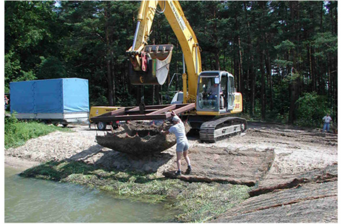
Mit Hilfe einer Traverse werden die einzelnen Elemente der Röhrichtgabione an dem vorgesehenen Standort plaziert.