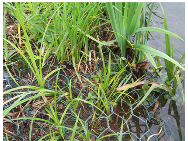
Detailaufnahme: Die Pflanzen sind in in der Röhrichtgabione (Steine, Kokos-matte, Gabionenmatratze) integriert.