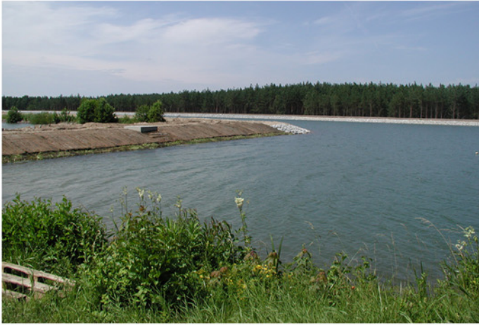
Aufweitungen entlang des Kanals als ökologische Rückzugsräume.

An einer Aufweitung des Oder-Havel-Kanals geht die am direkten Kanalufer notwendige massive Sicherung mit einer offenen Steinschüttung in eine ökologisch hochwertige Sicherung aus Röhrichtgabionen über. Im Bereich der Mittelwasserlinie sind sie mit Röhrichtmatten bepflanzt, die mit standortgerechten Röhrichtarten besetzt sind. Im Bereich darüber finden Gabionenmatratzen Verwendung. Die Hohlräume wurden mit Substrat verfüllt und die Matratze mit einem Kokos-Gewebe ummantelt. Hierdurch wird eine sukzessive Begrünung dieser Bereiche unterstützt.